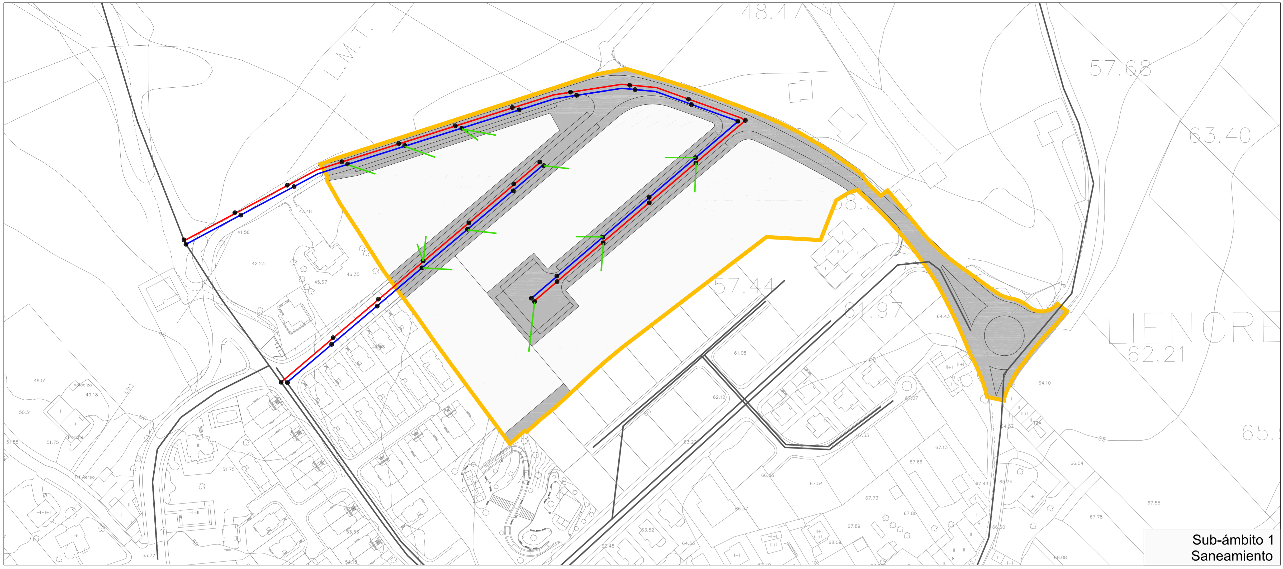
Sub-ámbito 1 Saneamiento